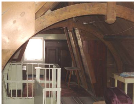
Twee schenkelspanten achterhuis