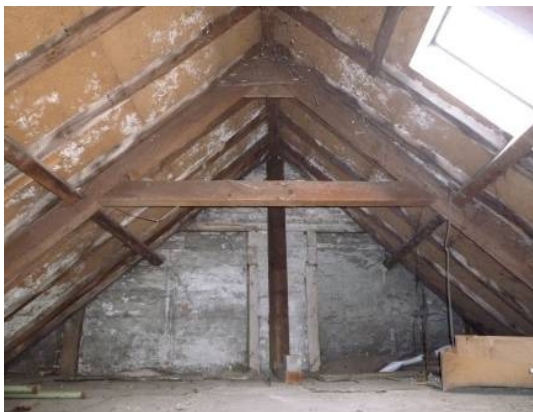
Kap met vliering voorgevel en twee blinde schuifnissen voor de schuifvensters van de vertrekken op de eronder gelegen zolderkamers.

Het achterste gedeelte van de zolder is een open ruimte met een zogenaamde ziende kap (een kap die in het zicht is en dus bij de gebruikruimte hoort). Deze kap wordt gedragen door twee schenkelspanten (gebogen spanten van grenen of vuren) met gordingen en een makelaar onder de nok. Het achterste deel van deze kap is uitgevoerd als sporenkap met zware sporen en deels met een A-spant met kreupele stijlen.