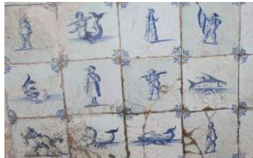
Zeedieren en mensen