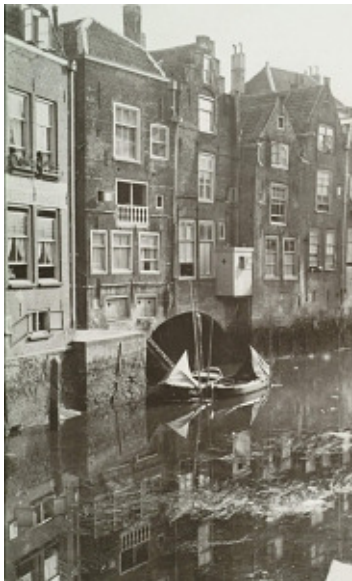
Voorstraatshaven met onderdoorgang naar Belgracht