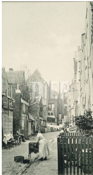
Gedempte Belgracht, 1905

De Belgracht maakte deel uit van het uitgebreide binnengrachtenstelsel van Dordrecht dat dienst deed als watervoorziening voor het huishouden, maar tegelijk ook gebruikt werd als (open) riool. Door regelmatig spuien van het stelsel werd het vuil uit de stad verwijderd en geloosd op de Spuihaven en vervolgens op de huidige Oude Maas.