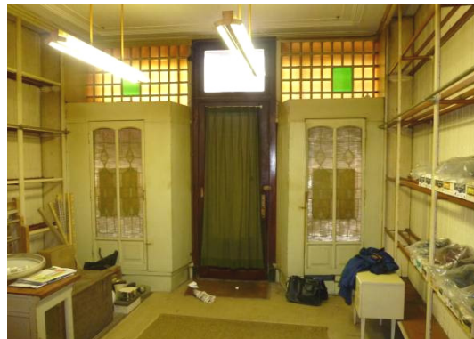
Winkelinterieur met achteraanzicht van de etalage

Op de begane grond was tot voor kort de winkel uit 1911 nog volledig in tact. De langswanden waren beschoten met staande kraaldelen waartegen open kasten, aan de rechter zijkant de toonbank. De etalages waren al medio jaren vijftig gesloten met hergebruikte deurtjes met bossing panelen onderin en twee ongedeelde ramen met een rondboog daarboven. De winkelruimte had een stucplafond met een midden-ornament en een brede stuclijst.