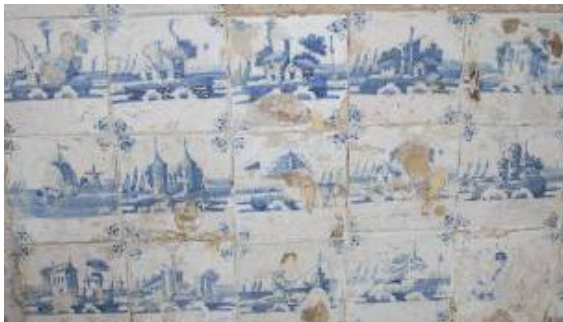
Huizen en kastelen

De nieuwe eigenaar van het pand heeft inmiddels de gesmoorde plavuizen verwijderd en heeft de kelder uitgegraven. Daarbij kwamen enkele interessante vondsten aan het licht. De oorspronkelijke kelder bleek nog een stuk dieper geweest te zijn en had wanden die betegeld waren met blauwe wandtegels. Het aardige was, dat dit vermoedelijk hergebruikte wandtegels waren, want ongeveer elke vierkante meter had een ander soort tegels, met verschillende voorstellingen die thematisch waren gerangschikt. Zo was er een metertje tegels met alleen voorstellingen van huizen en kastelen, een meter met alleen zeedieren en schelpen, een meter met alleen mensen afgebeeld, alleen bloemen, een meter van parse tegels. Omdat het pand geen monument is, kon Monumentenzorg niet verhouden dat de tegels uitgenomen zijn. De eigenaar gaat wel bekijken of hij een deel kan terugplaatsen.