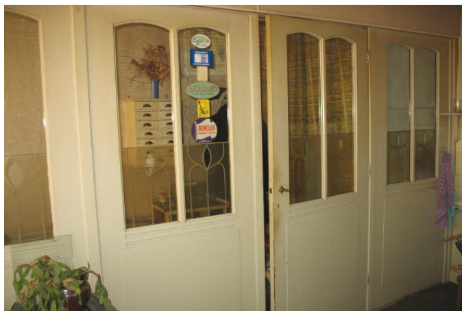
Achterwand van het verhoogde deel met afscheiding voor het kantoor.