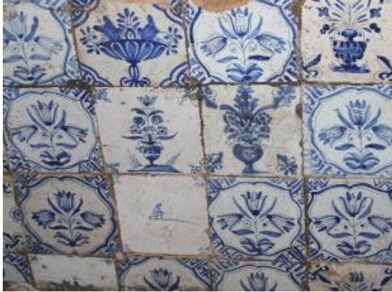
Bloemen en vazen