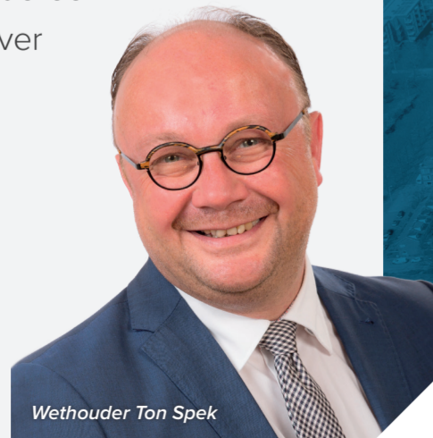
Wethouder Ton Spek

“Als woningeigenaar staat u er niet alleen voor! We maken samen een plan van aanpak voor uw buurt. Met de slimste oplossing om alle woningen aardgasvrij te maken. Op een manier die voor iedereen betaalbaar is. Wilt u meedenken over dit buurtplan? Meld u aan via duurzaamwonen@sliedrecht.nl . Na de zomer hoort u meer. En zetten we samen de schouders onder een duurzame toekomst!”