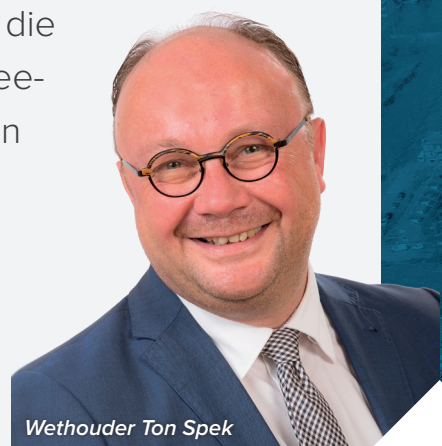
Wethouder Ton Spek

“Als woningeigenaar staat u er niet alleen voor! We maken samen een plan van aanpak voor uw buurt. Met de slimste oplossing om alle woningen aardgasvrij te maken. Op een manier die voor iedereen betaalbaar is. Wilt u meedenken over dit buurtplan? Meld u aan via duurzaamwonen@sliedrecht.nl . Na de zomer hoort u meer. En zetten we samen de schouders onder een duurzame toekomst!”