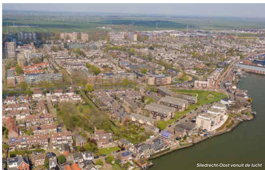
Sliedrecht-Oost vanuit de lucht

Heeft u vragen, ideeën of opmerkingen? Mail ons op duurzaamwonen@sliedrecht.nl .