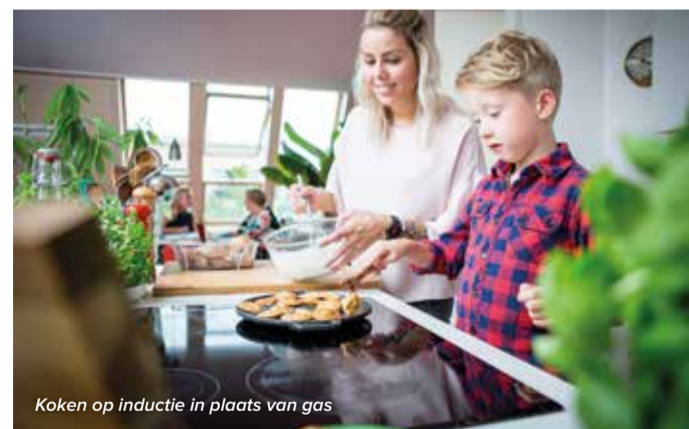
Koken op inductie in plaats van gas

Vanaf 2050 kunt u in principe niet meer koken op gas of stoken op aardgas. Die omslag is niet in één dag gemaakt. Als woningeigenaar hoeft u niet mee te doen, maar dat kan wel. In de komende periode zoeken wij graag mét u uit wat